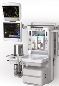
Система, монтируемая на стену (Carestation 650c)